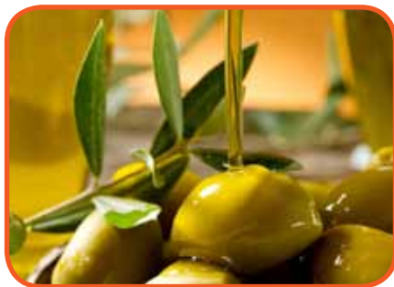
روغن زیتون برای سلامت قلب و عروق مفید است

◀ انواع روغن زیتون از لحاظ ترکیبات با یکدیگر متفاوت است؛ به طوری که ارزش تغذیه‌ای روغن زیتون بکر (تصفیه نشده) از روغن زیتون مخلوط و روغن زیتون تصفیه‌شده بیشتر است.